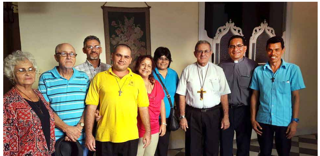
Des franciscains séculiers et visiteurs se rencontrent avec l'Archevêque de Havane.

Les visiteurs ont été accueillis par les frères capucins à l'église-couvent de Cristo de Limpas dans le vieux quartier de La Havane. La plupart des réunions se sont tenues à l'église Saint-François dans le centre historique de la ville, géré par l'OFM Conv.