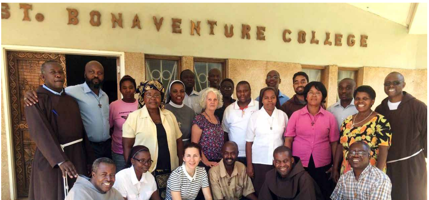
Quelques participants en JPIC et animateurs de la JeFra à Lusaka, Zambie.