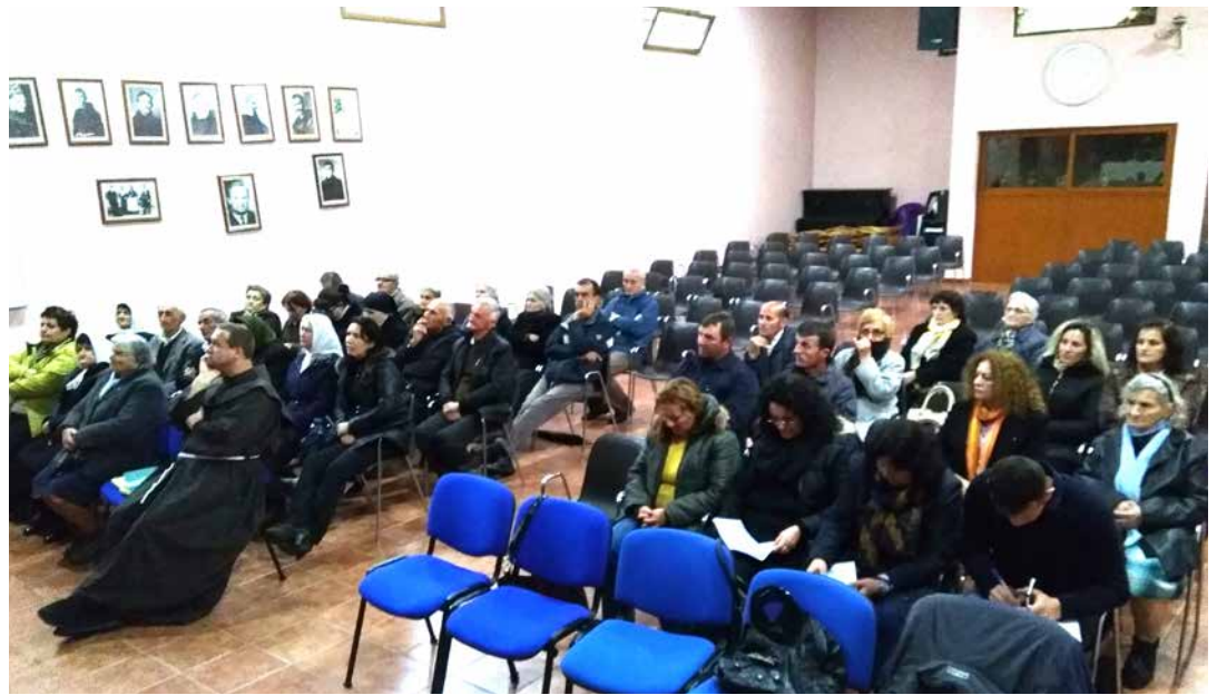
Délégués et observateurs présents au chapitre d'Albanie.