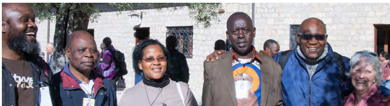
Des capitulaires africains profitent de la visite au Monastère de Saint Benoît

« C'est touchant qu'en quelque sorte ils pensaient qu'il est important de peindre un portrait de François ici. Il n'a pas encore été canonisé. »