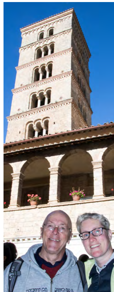
En bas de la montagne du monastère de Saint Benoît se trouve le Monastère de Sainte-Scolastique (la sœur de St Benoît).

« C'est touchant qu'en quelque sorte ils pensaient qu'il est important de peindre un portrait de François ici. Il n'a pas encore été canonisé. »