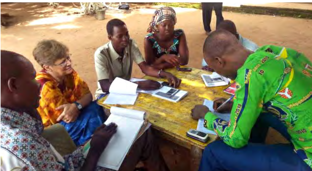
Les participants se réunissant en petit groupe à l'atelier francophone de formation au Tchad.