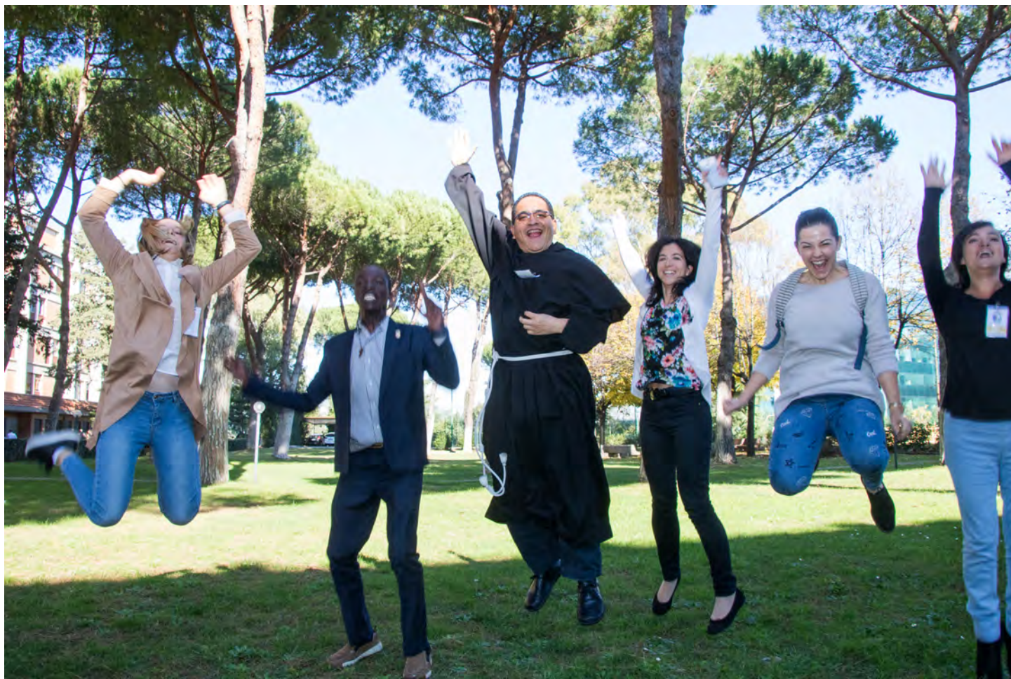
La presence de la Jeunesse JeFra dans la chapitre general.