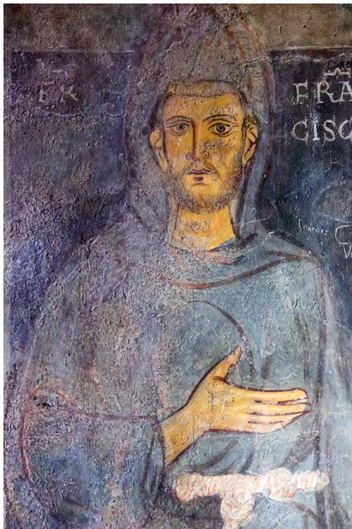
Fresque dans le monastère de Subiaco est censée être le premier portrait de François, créé dans sa vie.