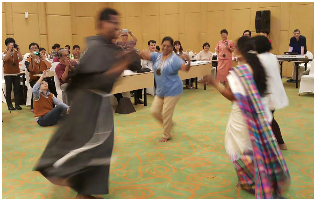
Au cours d'une soirée de partage fraternel et culturel au Congrès Asie Océanie, des participants venus d'Inde tournent en dansant avec un frère.