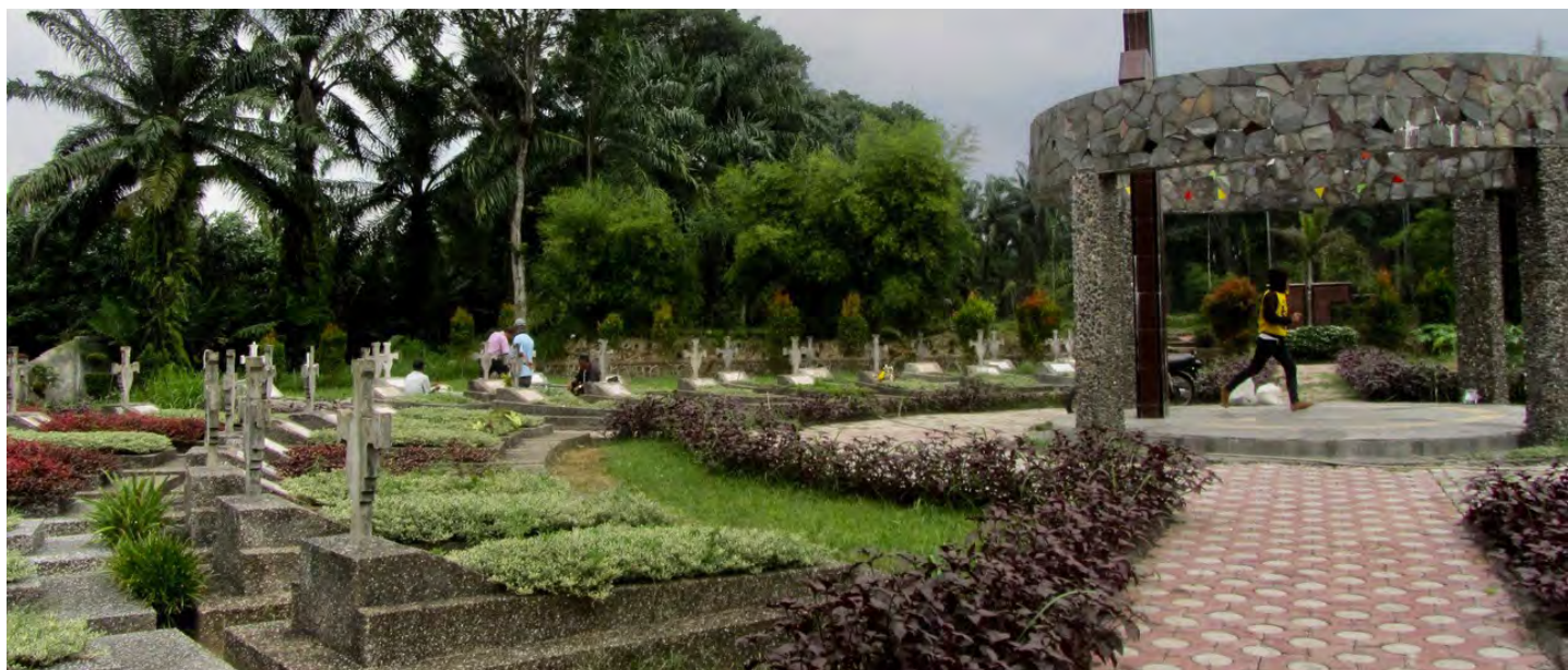
Cimetière à l'île Sumatra où repose Fr. Ben.