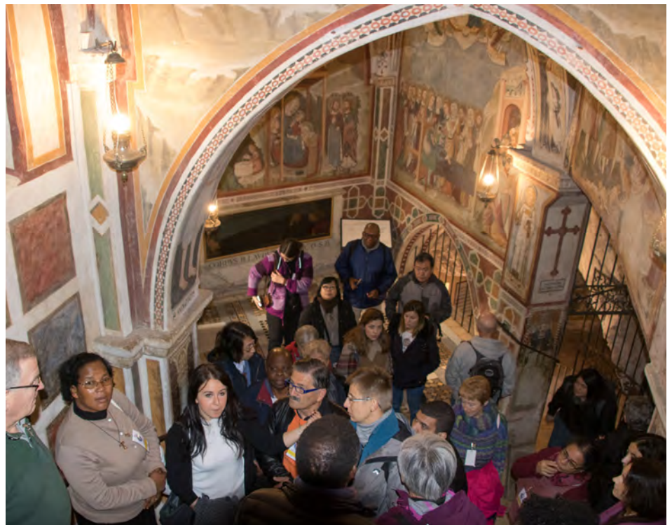
L'intérieur du monastère de Subiaco est couvert de fresques.