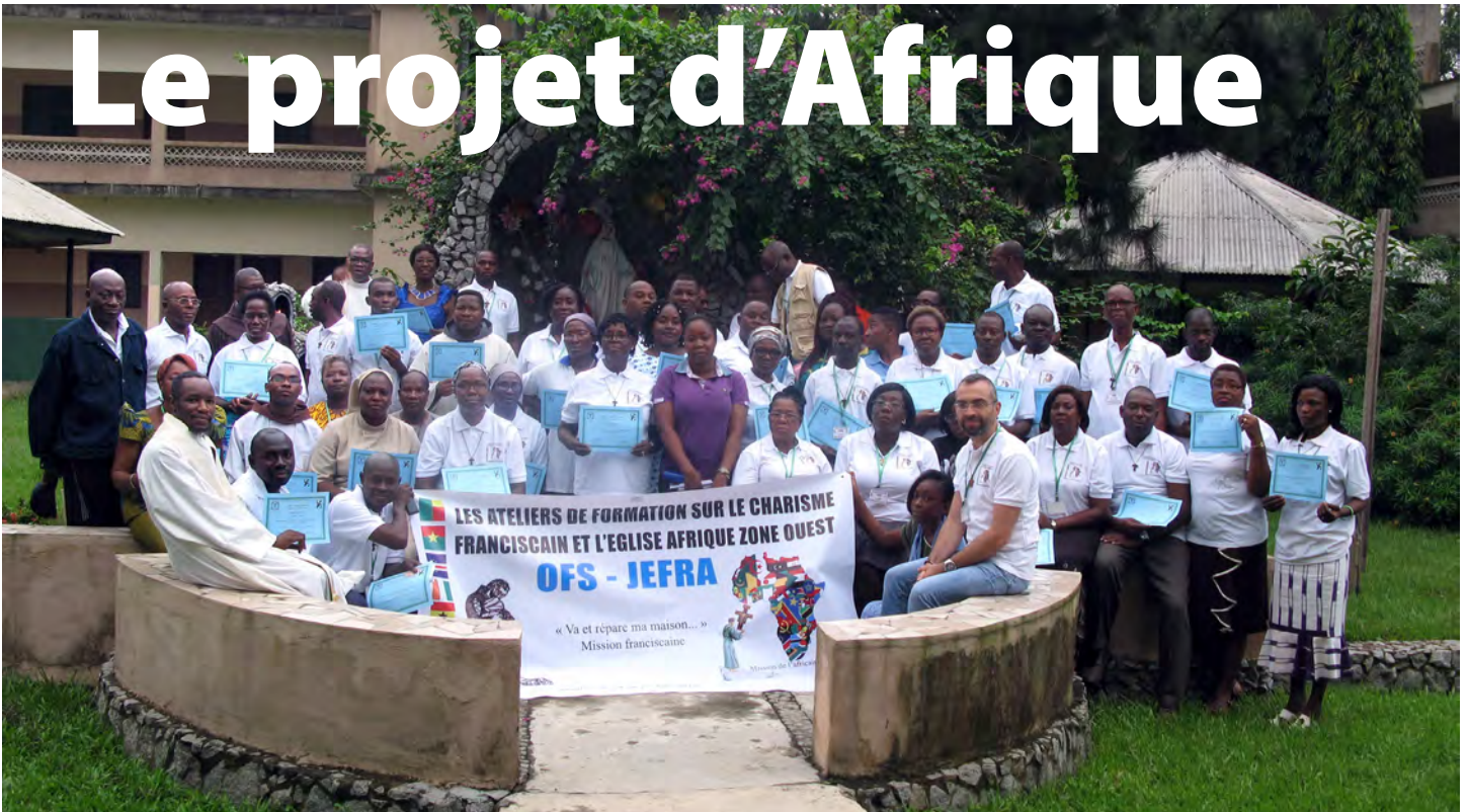
Les participants à l'atelier de formation à la Côte d'Ivoire pour les pays francophone au mois de juin.

Le Projet Afrique de l'Ordre Franciscain Séulier poursuit ses efforts pour apporter une formation aux frères et sœurs des Pays africains en conduisant deux ateliers francophones - un dans la Côte d'Ivoire du 14 au 17 juin et le deuxième au Tchad du 2