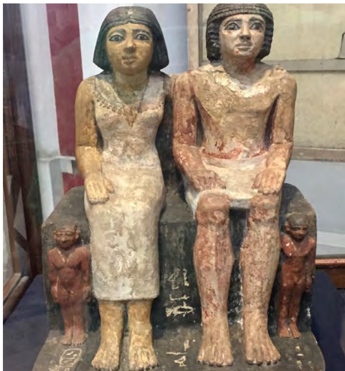
Une ancienne sculpture datant de 3500 ans.