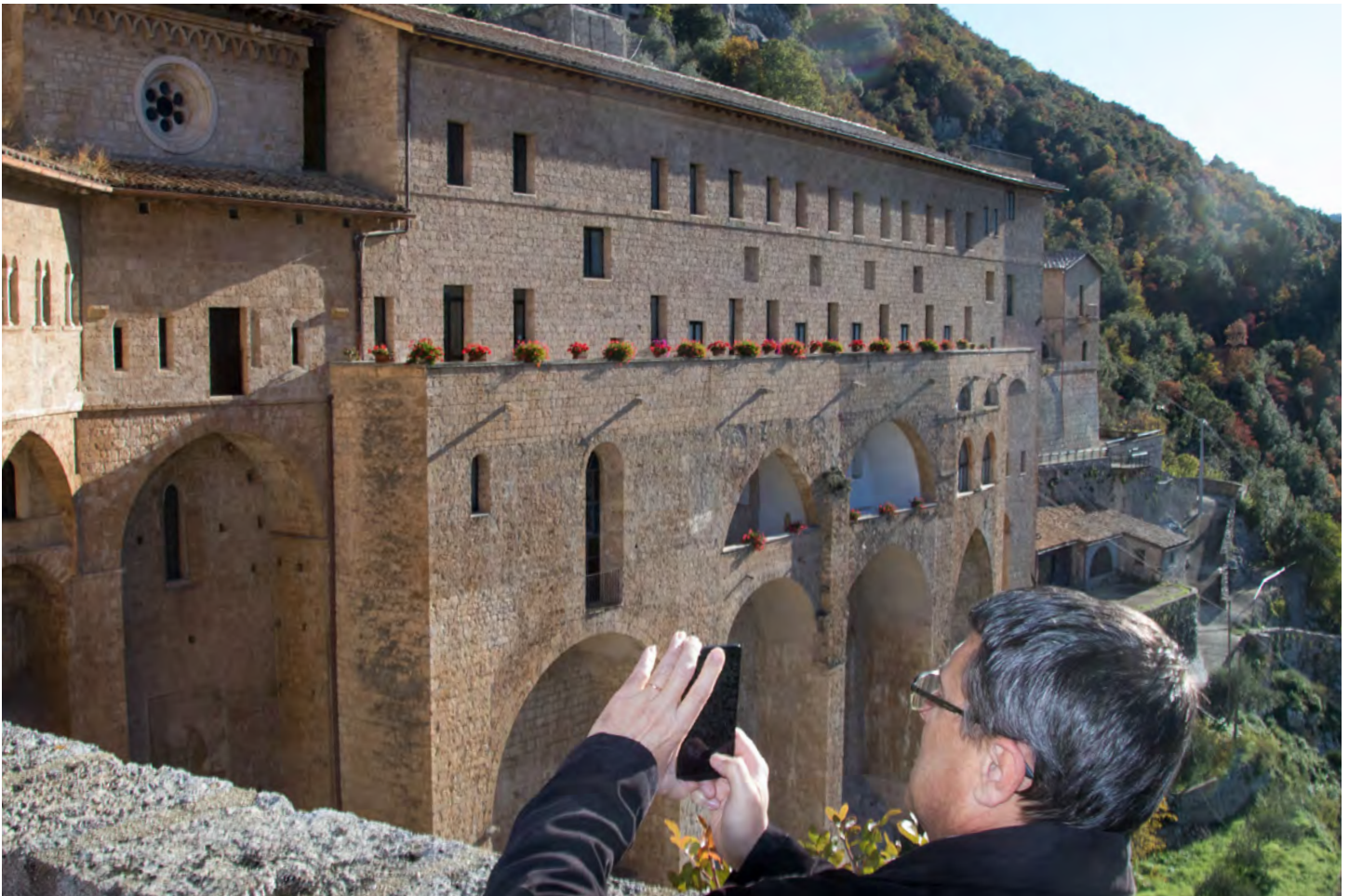
Le monastère des Bénédictines sur une montagne a Subiaco.