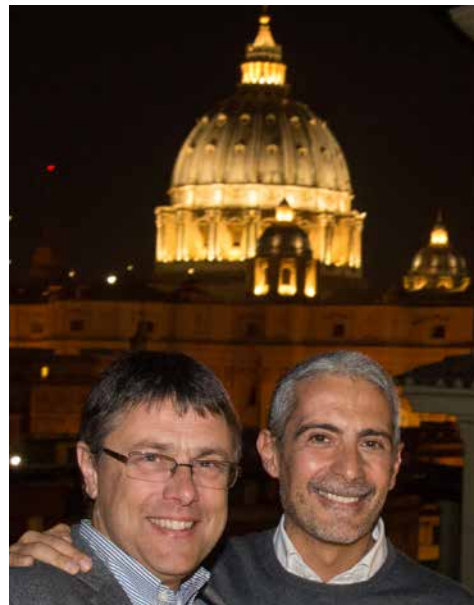
Le Ministre Général Tibor Kauser, OFS et le Ministre National Italien Remo di Pinto, OFS, posent sur la terrasse de la Maison de la Fraternité nationale, avec en arrière fond la Coupole illuminée de la Basilique Saint-Pierre.

dans un mur latéral tout à gauche de l'autel. La guide les a conduits dans ces souterrains après avoir mené le groupe par des labyrinthes où les fouilles archéologiques ont mis à jour des tombes païennes