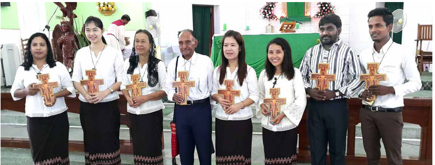
Les huit membres profès de la nouvelle Fraternité de Yangon au Myanmar.

La Fraternité est située à Yangon et compte huit membres profès, selon le rapport d'Augustine.