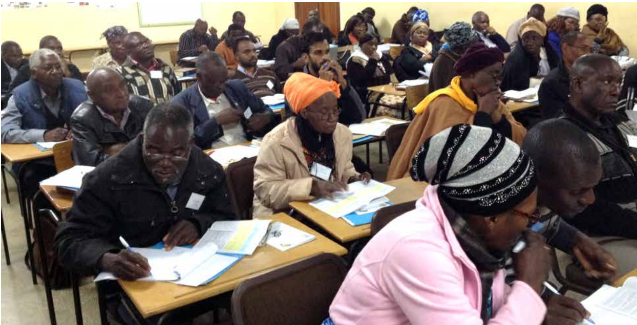
Des participants provenant de 11 pays ont pris part à l'atelier de formation africain.