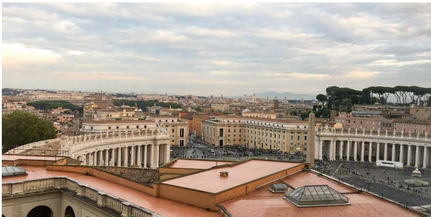
Vue de la Place Saint-Pierre et de Rome à partir d'une fenêtre du Palais Apostolique.

Avec une quarantaine de membres profès, la Fraternité a différentes tâches, y compris apporter de la nourriture aux sans-abri qui errent dans les gares.